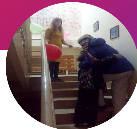
Технологии валеологического просвещения родителей